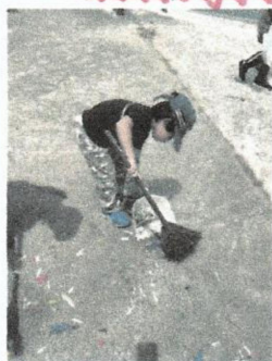
上手だね♡ すこーい