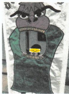
獅子舞 オイサ、オイサ