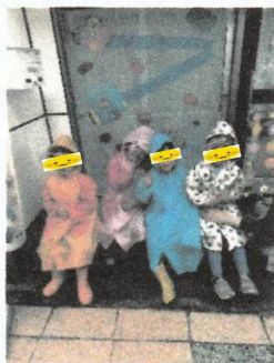
かわいい ちこバナナ