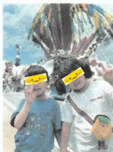
山笠の前で ベーカキ ごおっ!!