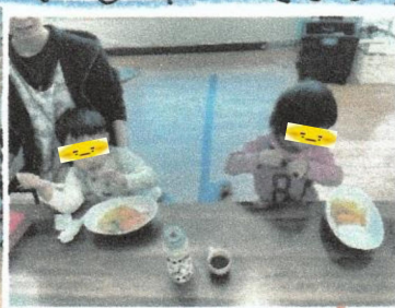
おいしいおいしい いただきます。