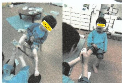
足うりくすぐたい